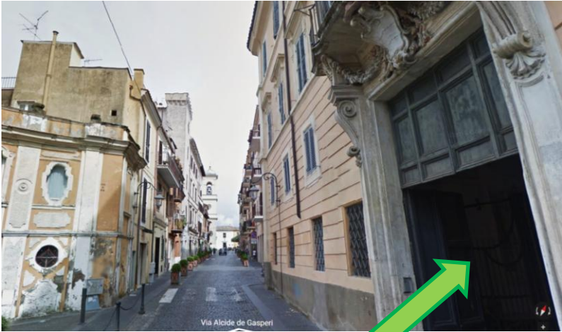
Palazzo Lercari - Ingresso Museo Diocesano